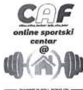
Slika. Presentacije digitalizacije sustava sporta.

sportske udruge. Aplikacijom će se provoditi cjelokupan proces Programa javnih potreba u sportu Grada Zadra, od prijave, vrednovanja, evaluacije, raspodjele sredstva praćenja rada, trenažnog rada, itd. Aplikacija je za članove u potpunosti bez troškova. Na radionici je prisustvovalo 90 - tak predstavnika članica.