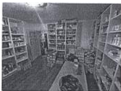
Slika. Zadarski sportaši u akciji prikupljanja potrepština za socijalnu samoposlugu.

Ad. 26) Zadarski sportaši još su jednom pokazali koliko je veliko njihovo srce. Šestu godinu zaredom 18. prosinca 2020. godine Udruga zadarskih sportskih novinara u suradnji sa Hrvatskim zborom sportskih novinara, sportskim udrugama sa područja Grada Zadra, organizirala je veliku humanitarnu akciju „darivanja za Socijalnu samoposlugu Zadar“. Kao i prethodnih godina, odaziv je ponovno bio primjeren. Prikupljenim potrepštinama se osigurala pomoć za najpotrebnije građane Grada Zadra, čime su sportaši pokazali koliko je veliko zadarsko srce i izvan sportskih terena.