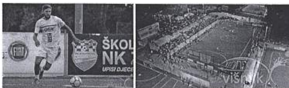
Slika. Memorijalnog turnira Antonio Jurjević – Zadar 2020.

Ad. 24) U sklopu promocije i potpore zadarskom sportu, Grad Zadar je pomogao organizaciju završnoga turnira Kupa Krešimira Čosića u košarci. Natjecanje se održalo u suorganizaciji Košarkaškog kluba „Zadar“ i Športskog centra Višnjik, a uz potporu Grada Zadra od 12. do 15. veljače 2020. godine.