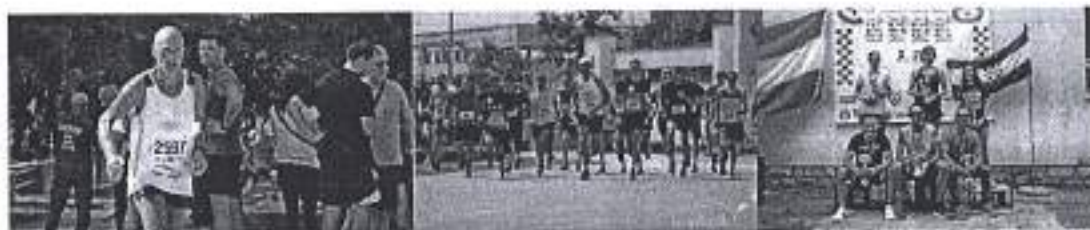
Slika. Atletska utrka Petica za domovinu 2020.

Ad. 13) U sklopu promocije zadarskoga sporta, održana je atletska utrka pod nazivom „Petica za domovinu“ povodom Dana hrvatske državnosti 30. svibnja, koju su organizirali AK Alojzije Stepinac i KAV Zadar. Utrka je održana 30. svibnja 2020. kod Dvorane Krešimira Čosića na Višnjiku, sudionici su se natjecali u sedam dobnih kategorija (muškarci), odnosno u pet (žene), te je sudjelovalo oko 50 sudionika, sukladno preporukama vezanih uz pandemiju COVID 19.