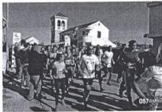
Slika: Atletska trka linijom obrane grada Zadra 2020.