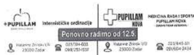
Slika. Program Zdravstvena skrb sportaša

liječnik, temeljem dosadašnjeg Zakona. U troškovima rada specijalističkih ordinacija sportske medicine sudjeluju: Grad Zadar, sami sportaši – preglednici. Ordinacija sportske medicine u razmatranom razdoblju u 2020. provele su sljedeće: sistematske liječničke preglede sportaša sa područja Grada Zadra i Zadarske županije, približno 2800 sistematskih pregleda, program zdravstvene zaštite sportaša i drugih sudionika u sportu na razini Grada Zadra, koordinacija aktivnosti s Hrvatskim olimpijskim odborom i Hrvatskim zavodom za toksikologiju i antidoping vezanim za program borbe protiv korištenja nedozvoljenih sredstava i antidoping 13 , suradnja sa Zdravstvenim povjerenstvom Hrvatskog olimpijskog odbora, nadležnim tijelima za sport u Gradu Zadru i Zadarskoj županiji radi traženja rješenja i sustava koji će jamčiti uspostavu stalne kontrole zdravlja svih sportaša i uz to, osposobljene djelatnike - specijaliste. U 2020. godini za realizaciju navedenog programa Športska zajednica je raspisala Javnu nabavu gdje su se javile specijalističke ordinacije, provedbu programa temeljem prihvaćanja najpovoljnije ponude javne nabave provodila je Ustanova za zdravstvenu skrb „Pupillam nova“, Katarine Zrinski 1 d, 23000 Zadar. Program se realizirao sredstvima u iznosu od 199.800 kuna, osiguranih Financijskim planom Športske zajednice za 2020. godinu, preostala sredstva su prenamijenjena u skladu sa Financijskim planom Športske zajednice Grada Zadra za 2020. godinu.