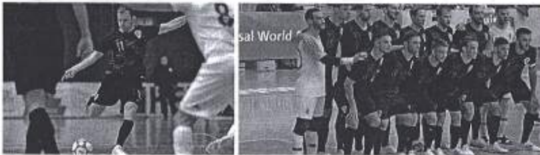
Slika. Kvalifikacije za Svjetsko malonogometno prvenstvo – Zadar 2020.

Ad. 20) U sklopu promocije zadarskoga sporta, Grad Zadar je poduprijeo organizaciju Hrvatskog nogometnog saveza i Športskog centra Višnjik d.o.o. u vidu kvalifikacijskih utakmica Hrvatske reprezentacije u futsalu u sklopu doigravanja za Svjetsko prvenstvo u futsalu.