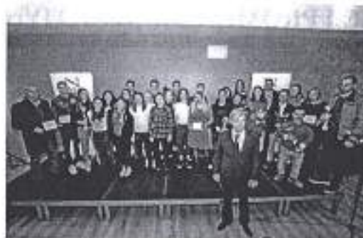
Slika. Dodjela nagrada za najbolje sportaše za 2019.

Ad. 2) Grad Zadar, koji je uložio znatna financijska sredstva u suradnji sa Veslačkim klubom Jadran u završio je sa radovima na adaptaciji Veslačkog doma u Jazinama, koji su započeli u rujnu prošle godine. Zahvat adaptacije obuhvatio je 450 m 2 prohodne terase, tri svlačionice sa tuš kabinama te dva sanitarna čvora. Projekt je izradila Aniva Inženjering d.o.o. s kojom je Grad Zadar kroz proračun Upravnog odjela za kulturu i sport, potpisao ugovor o izvođenju radova u vrijednosti od 995.461,34 kune + PDV nakon provedenog postupka javne nabave.