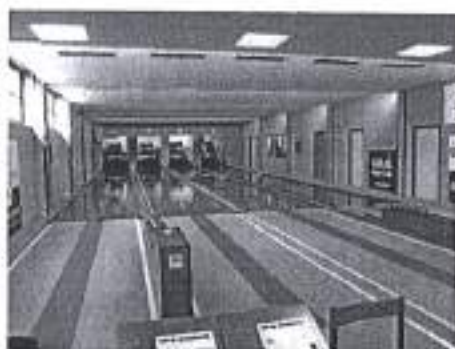
Slika. Program održavanje i korištenje sportskih građevina - kuglačka dvorana Mocire 2020.

U razmatranom razdoblju 2020. godine, Športska zajednica je poticala na održavanje i izgradnju sportskih objekata. sa kojom je 02. travnja 2020. godine, potpisan Ugovor (2198/01-61-20-163) za provedbu navedenog programa. Ukupan iznos odobrenih sredstva u navedenom programskom području iznosio je 10.000 kuna, program je realiziran sredstvima u iznosu od 44.595 kuna, osiguranih Financijskim planom Športske zajednice za 2020. godinu.