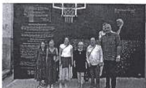
Slika. Obnova koša i pročelja zgrade

Ad. 16) Udruga „Dani Krešimira Čosića“ je potaknula obnovu spomen koša i pročelja zgrade na kojemu je zadarski velikan Krešimir Čosić prvi put zaigrao košarku.