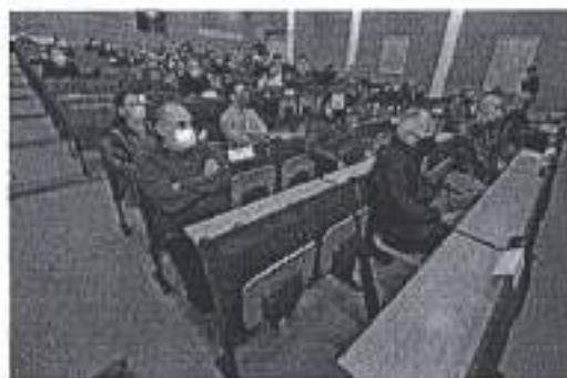
Slika. Prezentacija knjige „Prelet za Hrvatsku“

Ad. 18) U sklopu promocije i potpore zadarskom sportu, Aero klub Zadar je organizirao akcije kojima su se popularizirale aktivnosti sportskog zrakoplovstva i srodnih djelatnosti u području sporta s ciljem omasovljenja i približavanja svoga djelovanja javnosti. Aktivnosti su se održale 16. i 19. studenoga 2020 godine, u vidu prezentacije knjige „Prelet za Hrvatsku“ na Novom kampusu zadarskog Sveučilišta i demonstracije virtualnog letenja s simulatorima i radiotelegrafije u prostorijama Aero kluba Zadar uz sudjelovanje djece osnovnih škola Grada Zadra. Aktivnosti su održane u skladu sa uvjetima pandemije bolesti COVID-19 i poštivanja zadanih epidemioloških mjera.