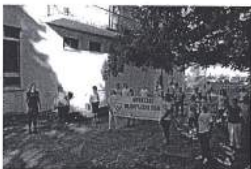
Slika. Demonstracija trenažnih procesa u području sportske rekreacije 2020.

Ad. 11) U sklopu promocije zadarskoga sporta i njegovih svekolikih sastavnica, Športska zajednica je 10. rujna 2020. godine, povodom obilježavanja Hrvatskog olimpijskog dana podržala demonstraciju i predstavljanje sportova i sportskih udruga. U obilježavanju su sudjelovali predstavnici iz nogometa, košarke, odbojke i sportske rekreacije rekreacije.