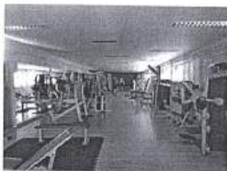
Slike, Program aktivna zajednica 2020.