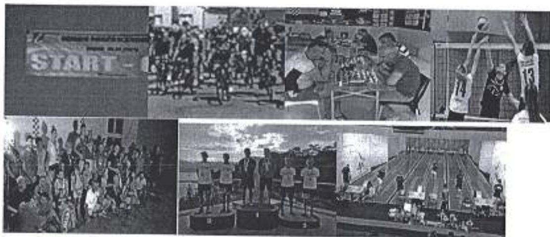
Slika. Sufinanciranje ostalih sportskih programa udruga - neplanirani troškovi kvalifikacija na državnoj razini i završnica državnog prvenstva

Predviđena je realizacija programa sredstvima u iznosu od 50.000 kuna, osiguranih Financijskim planom Športske zajednice za 2020. godinu, dok su izmjenama i dopunama sredstva iznosila 52.000 kuna, preostala sredstva su prenamijenjena u skladu sa Financijskim planom Športske zajednice za 2020. godinu.