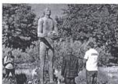
Slika. Obilježavanje smrti 25-godišnjice košarkaškog velikana Krešimira Čosića

zapalili svijeće te na taj način obilježili 25 godina od kada nas je napustio jedan od najvećih europskih i svjetskih košarkaških virtuoza.