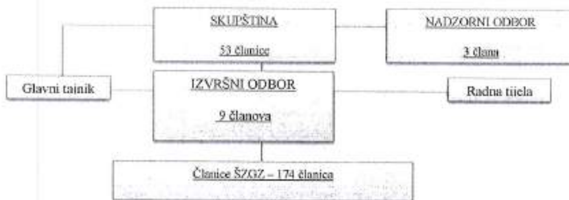
Organigram br. 1 Organizacijski ustroj Športske zajednice Grada Zadra