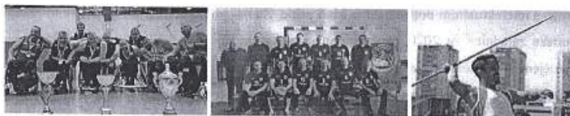
Slike. Program sporta osoba s invaliditetom 2020.