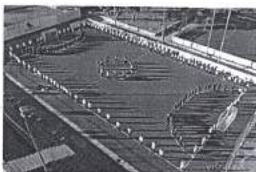
Slika. Nogometni turnir 2020.

Ad. 6) Dana 13. siječnja 2020. godine na Športskom centru Višnjik d.o.o. održan je zimski turnir u nogometu, gdje je sudjelovalo oko 240 malih sportaša iz svih nogometnih klubova sa područja Grada Zadra.