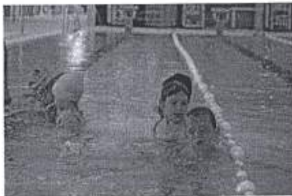
Slike „Obuka neplivača u školama“ 2020. godini.

sredstva su prenamijenjena u skladu sa Financijskim planom Športske zajednice za 2020. godinu.