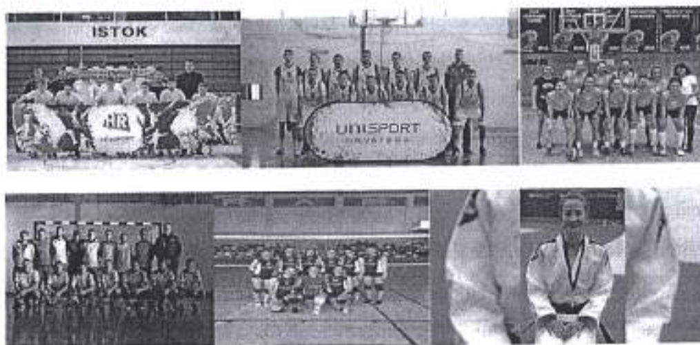
Slika. Sveučilišni sport – školska godina 2019/2020.