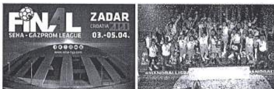
Slika. Završni turnir SEHA lige – Zadar 2020.

Ad. 23) U sklopu promocije i potpore zadarskom sportu, Grad Zadar je pomogao organizaciju završnoga turnira SEHA lige od 4. do 6. rujna 2020. u Dvorani Krešimira Čosića na Višnjiku.