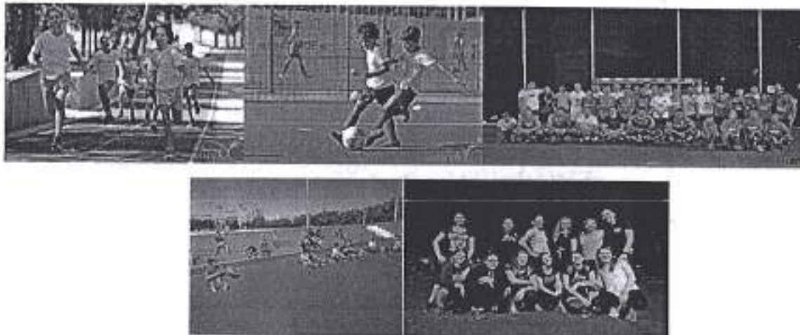
Slike. Obilježavanje Hrvatskog olimpijskog dana u Gradu Zadru.

Sukladno situaciji vezanoj za pandemiju bolesti COVID-19, Financijski plan Športske zajednice Grada Zadra za 2020. godinu se umanjio odlukom Grada Zadra za suspenzijom navedenih sredstva, što je na prijedlog Izvršnog odbora Športske zajednice Grada Zadra također donijela Skupština Športske zajednice Grada Zadra. Planirani iznos se umanjuje za 5.000 kuna, te se nije realizirao u ovoj financijskoj godini, već je proveden u potpunosti „libri“ od strane stručne službe Športske zajednice Grada Zadra.