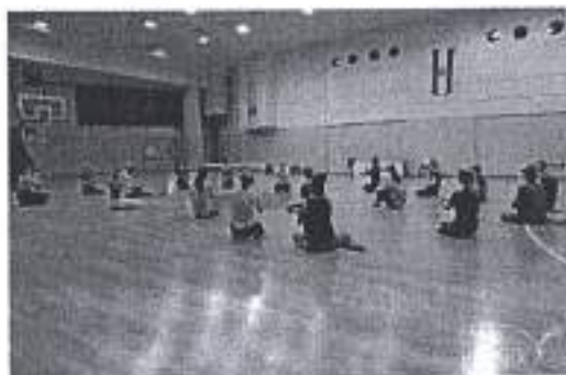
Slike. Obilježavanje Međunarodnog olimpijskog dana u Gradu Zadru.

Ukupan iznos odobrenih sredstva planom za 2020. u navedenom programskom području iznosio je 5.000 kuna, sukladno situaciji vezanoj za pandemiju bolesti COVID-19, Financijski plan Športske zajednice za 2020. godinu se umanjio odlukom Grada Zadra za suspenzijom navedenih sredstva, što je na prijedlog Izvršnog odbora Športske zajednice Grada Zadra također donijela Skupština Športske zajednice Grada Zadra. Planirani iznos se umanjuje za 5.000 kuna, te se nije financijski realizirao u ovoj financijskoj godini, već je program proveden u potpunosti „ liberi “ od strane stručne službe Športske zajednice Grada Zadra, sredstva su prenamijenjena u skladu sa financijskim planom Športske zajednice Grada Zadra za 2020. godinu.