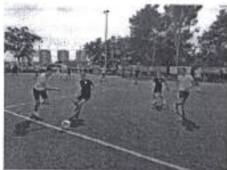
Slika „Sportske igre mladih 2020“ - turnir u malom nogometu Cola Cola cup 2020.

Iznos odobrenih sredstva planom za 2020. u navedenom programskom području iznosio je 5.000 kuna, a program je u cijelosti realiziran sredstvima u iznosu 1.125 kuna, preostala sredstva su prenamijenjena u skladu sa Financijskim planom Športske zajednice Grada Zadra za 2020. godinu.