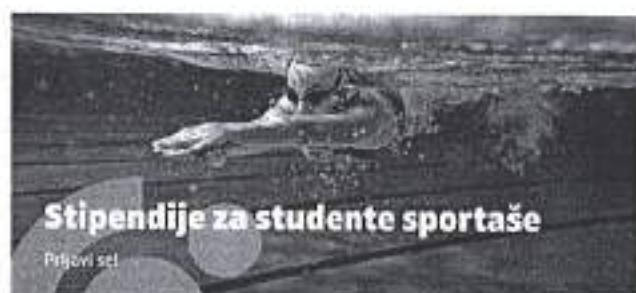
Slika. Stipendije za sportaše 2020.

Ad. 15) U sklopu promocije zadarskoga sporta, OTP banka je pokrenula projekt "Zeleno svjetlo za ... bolje društvo"... vođeni željom da potičemo izvrsnost u sportu na hrvatskim sveučilištima i školama, OTP banka, nagrađuje mlade ljude koji uz akademsko obrazovanje ostvaruju i zavidne sportske rezultate. Izdvojena su sredstva za četiri stipendije za studente sportaše u novoj akademskoj godini. Športska zajednica je potaknula sportaše da se prijave na natječaj.