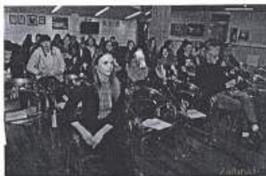
Slika. Predavanje Sport i zdravlje.

Ad. 4) U organizaciji Visoke škole Aspire iz Splita dana 04. ožujka 2020. u 12:00 sati na Višnjiku u Zadru održano je predstavljanje Aspirinih studijskih programa studija Sportskog menadžmenta. Na predavanjima je sudjelovalo oko 40-tak sudionika.