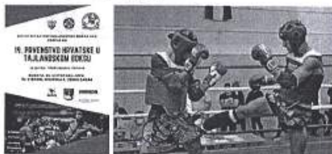
Slika. Državnog prvenstva u tajlandskom boksu – Zadar 2020.

Ad. 21) U sklopu promocije i potpore zadarskom sportu, Grad Zadar je potpomogao organizaciju državnog prvenstva u tajlandskom boksu, 24. listopada 2020. u dvorani Krešimira Ćosića. Organizatori su Hrvatski savez tajlandskog boksa i zadarski klub KBK I TB Sv. Zoilo te Športski centar Višnjik d.o.o.