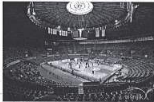
Slika. Odbojkaški turnir – Zadar 2020.

priprema za domaćinstvo prvoga kvalifikacijskoga turnira za mušku seniorsku reprezentaciju u skupini A za plasman na Europsko prvenstvo u rujnu 2021. godine.