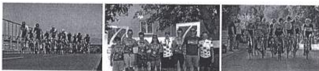
Slika. Nacionalno prvenstvo u cestovnom biciklizmu u Zadru 2020.

Ad. 12) U sklopu promocije zadarskoga sporta, Športska zajednica je podržala organizaciju Biciklističkog kluba Zadar koji je organizirao Nacionalno prvenstvo u cestovnom biciklizmu u 19. srpnja 2020. godine u Gradu Zadru. Na prvenstvu je sudjelovalo niz istaknutih sportaša te su zadarski biciklisti postigli zapažene rezultate te osvojili četiri prva mjesta te nekolicinu drugih te trećih mjesta.