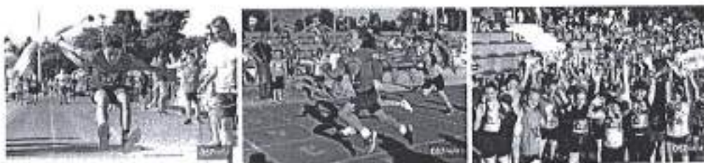
Slike. Erste liga u Zadru 2020. godine.

Iznos odobrenih sredstva planom za 2020. godine u navedenom programskom području iznosio je 5.000 kuna, te je program u cijelosti realiziran u iznosu od 5.000 kuna, sukladno Financijskom planu Športske zajednice Grada Zadra za 2020. godinu.