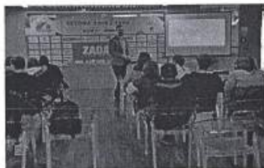
Slika. Predstavljanje škole Visoke Aspira 2020.

Ad. 4) U organizaciji Visoke škole Aspire iz Splita dana 04. ožujka 2020. u 12:00 sati na Višnjiku u Zadru održano je predstavljanje Aspirinih studijskih programa studija Sportskog menadžmenta. Na predavanjima je sudjelovalo oko 40-tak sudionika.