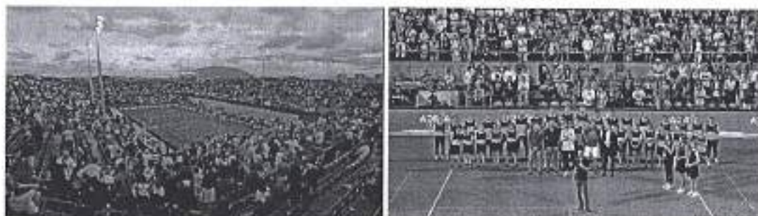
Slika. Adria Tour – Zadar 2020.

Ad. 25) U sklopu promocije i potpore zadarskom sportu, Grad Zadar je pomogao organizaciju Adria Tura u tenisu koji se 20 i 21. lipnja održao u Zadru. Natjecanje se održalo u suorganizaciji: Tvrtke Adria tour, Hrvatskog teniskog saveza i Športskog centra Višnjik d.o.o. Na natjecanju su nastupile međunarodne teniske zvijezde, gdje se isticao prvi igrač svijeta Novak Đoković.