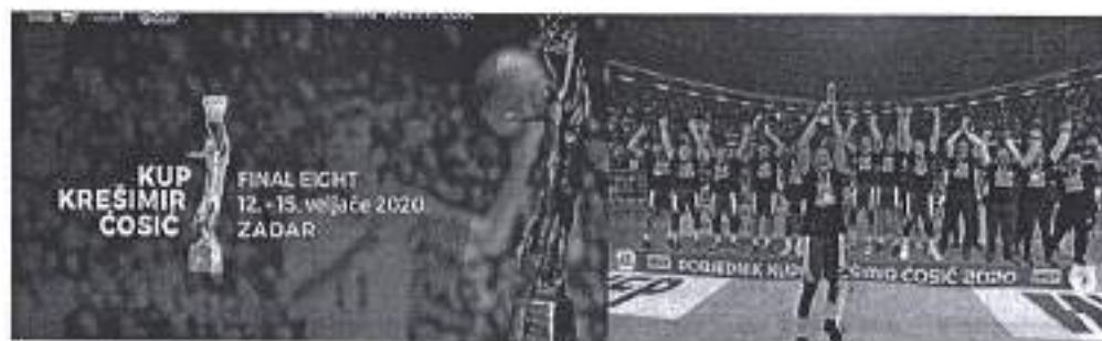
Slika. Završni turnira Kupa Krešimira Čosića – Zadar 2020.

Ad. 24) U sklopu promocije i potpore zadarskom sportu, Grad Zadar je pomogao organizaciju završnoga turnira Kupa Krešimira Čosića u košarci. Natjecanje se održalo u suorganizaciji Košarkaškog kluba „Zadar“ i Športskog centra Višnjik, a uz potporu Grada Zadra od 12. do 15. veljače 2020. godine.