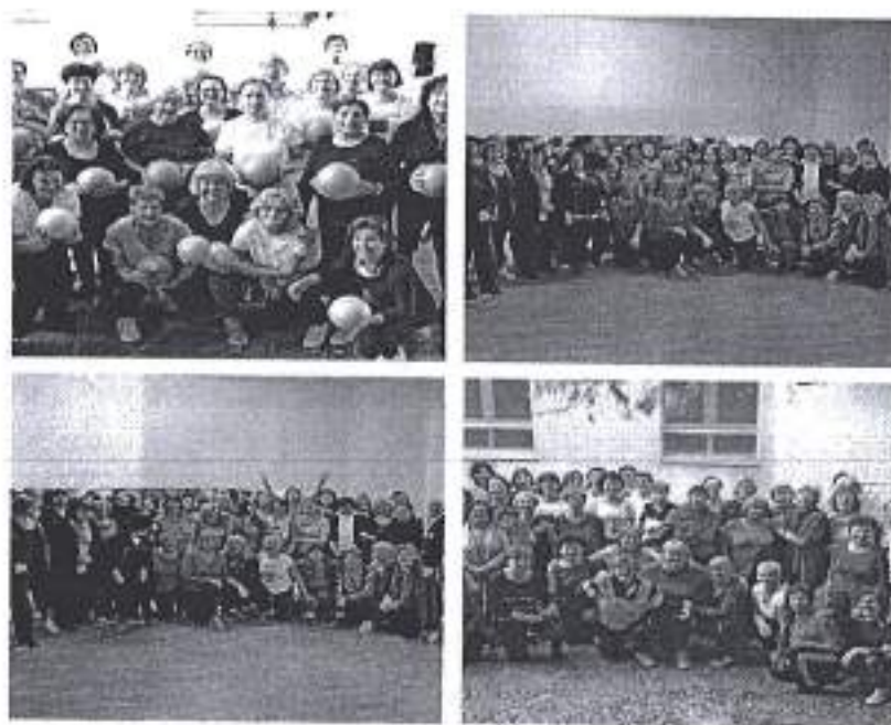
Slike. Provedba programa Sportska rekreacija za umirovljenike 2020.