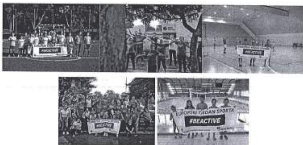
Slike. Obilježavanje Europskog tjedna sporta u Gradu Zadru 2020