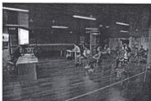
Slika. Radionice na temu prikupljanja prijedloga programa za izradu programa javnih potreba u sportu grada Zadra u 2021. godini.

Ad. 11) U sklopu promocije zadarskoga sporta i njegovih svekolikih sastavnica, Športska zajednica je 10. rujna 2020. godine, povodom obilježavanja Hrvatskog olimpijskog dana podržala demonstraciju i predstavljanje sportova i sportskih udruga. U obilježavanju su sudjelovali predstavnici iz nogometa, košarke, odbojke i sportske rekreacije rekreacije.