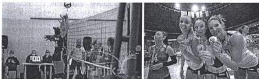
Slika. Državna prvenstva u odbojci za mlade dobne kategorije – Zadar 2020 i završnice natjecanja u Kupu RH za žene i muškarce.

Ad. 22) U sklopu promocije i potpore zadarskom sportu, Grad Zadar je potpomogao organizaciju završnih turnira državnih prvenstava za mlade kategorije u odbojci te završnice turnira u kupu za žene i muškarce koji su održani tijekom rujna i listopada 2020. godine u Dvorani Krešimira Čosića na Višnjiku, u organizaciji Hrvatskoga odbojkaškoga saveza, te uz potporu Odbojkaškog kluba Zadar i Športskog centra Višnjik d.o.o.