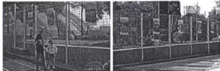
Slike. Zadar, Europski grad sporta 2021.

Ad. 18) U sklopu promocije i potpore zadarskom sportu, Aero klub Zadar je organizirao akcije kojima su se popularizirale aktivnosti sportskog zrakoplovstva i srodnih djelatnosti u području sporta s ciljem omasovljenja i približavanja svoga djelovanja javnosti. Aktivnosti su se održale 16. i 19. studenoga 2020 godine, u vidu prezentacije knjige „Prelet za Hrvatsku“ na Novom kampusu zadarskog Sveučilišta i demonstracije virtualnog letenja s simulatorima i radiotelegrafije u prostorijama Aero kluba Zadar uz sudjelovanje djece osnovnih škola Grada Zadra. Aktivnosti su održane u skladu sa uvjetima pandemije bolesti COVID-19 i poštivanja zadanih epidemioloških mjera.