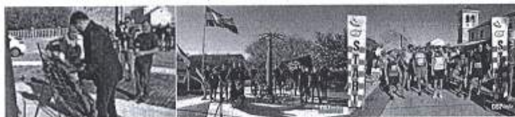
Slika. Obilježavanje obrane Grada Zadra 2020.

Ad. 9) Športska zajednica Grada Zadra je potpomogla u sklopu Festivala sporta i rekreacije 1,2,3 održavanje krosa linijom obrane Grada Zadra u listopadu 2020. godine gdje je polaganjem vijenaca na spomen obilježju poginulim hrvatskim braniteljima na Trgu svetog Šimuna i Tadija na Bokanjcu te startom kros utrke "Linijom obrane Grada" jutros je započeo program obilježavanja Grada obrane grada Zadra. Mladi atletičari te brojni rekreativci uputili su se linijom koje su držali hrvatski branitelji u obrani Zadra, od Bokanjca do Dračevca.